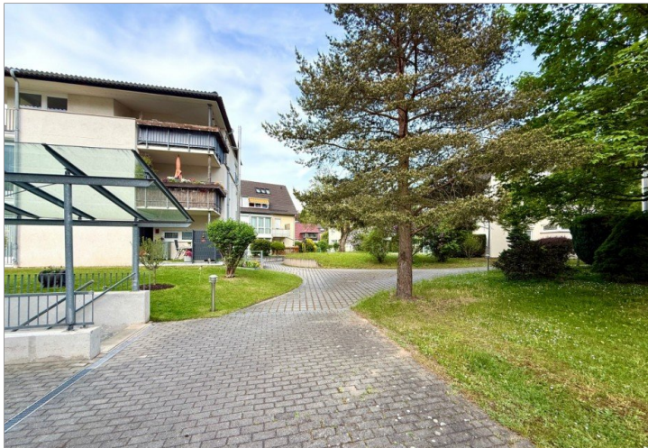
Eingang zur Tiefgarage