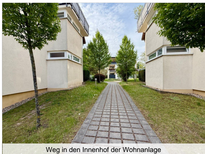
Weg in den Innenhof der Wohnanlage