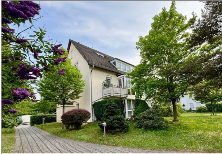
Parkähnlich gestaltetes Grundstück