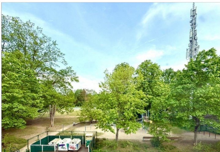
Blick auf den Park mit Spielplatz