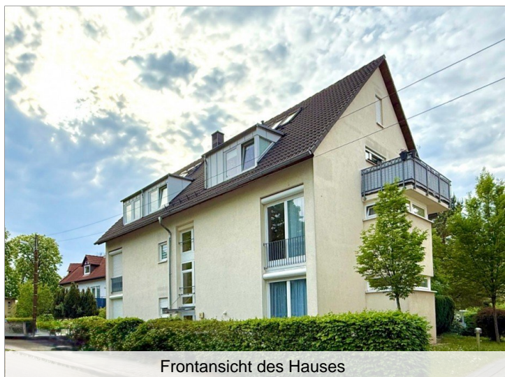
Frontansicht des Hauses