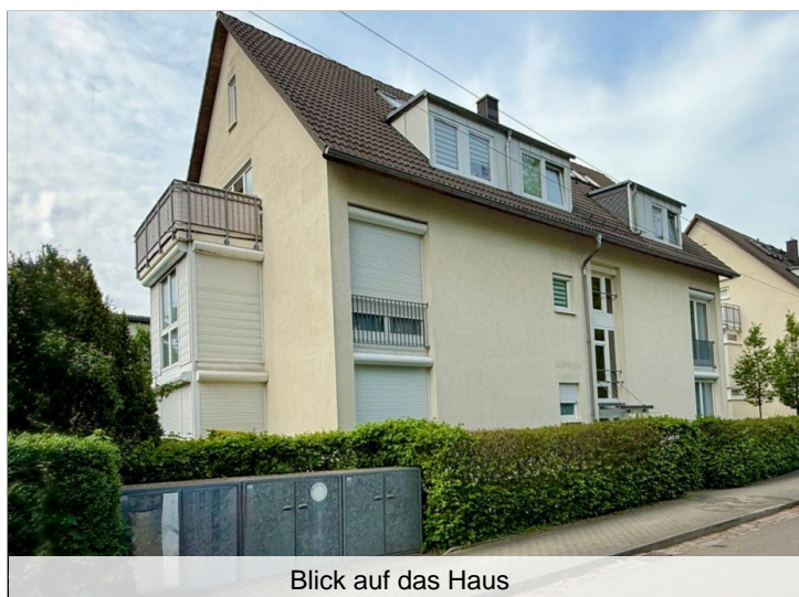
Blick auf das Haus